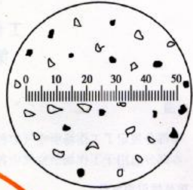
图3 粉尘分散度的测量

3.4.3 分散度的测定：取下物镜测微尺，将粉尘标本放在载物台上，先用低倍镜找到粉尘颗粒，然后在标定目镜测微尺所用的放大倍率下观察，用目镜测微尺随机地依次测定每个粉尘颗粒的大小，遇长径量长径，遇短径量短径。至少测量200个尘粒(见图3)。按表1分组记录，算出百分数。