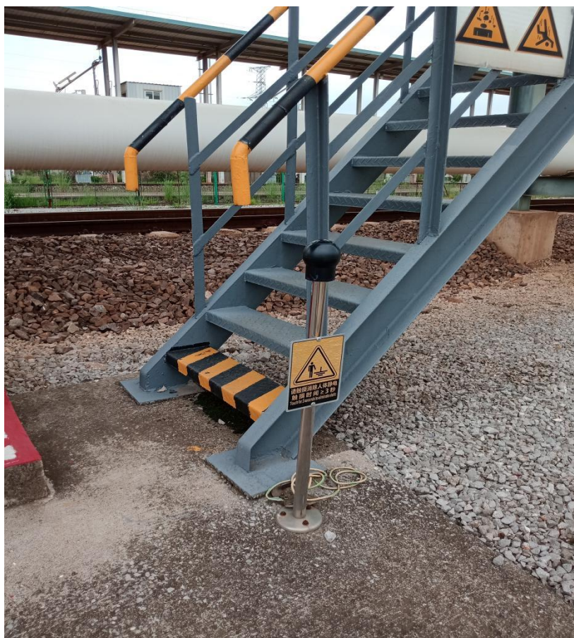
图 2-9 栈桥下方人体静电导除装置