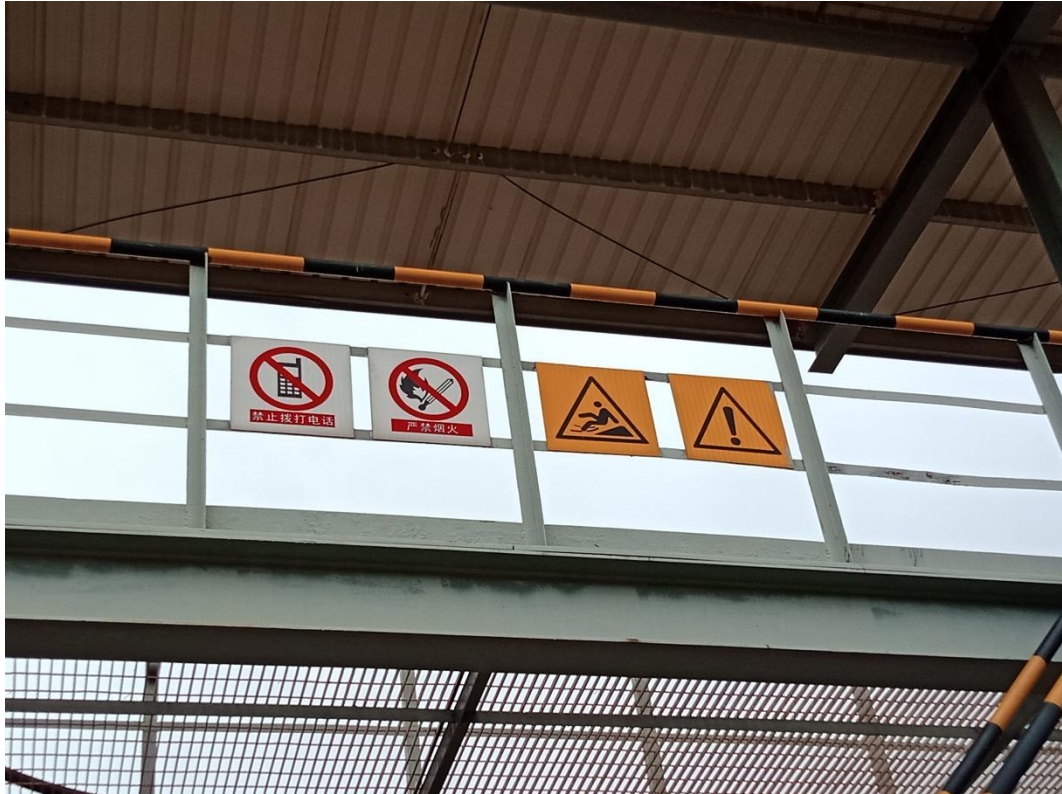
图2-10 栈桥上警示标识牌

在中航油货运站各功能房间设置电话、网络和电视插座。在货运室值班室安装专用受警录音直拨电话一部。为方便卸油站工作人员的联络，设置5部无线防爆对讲机，变配电间、应急设备间设置应急照明。警示标志牌台账见表2-2。