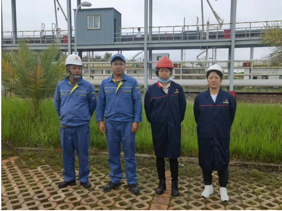
图 2-12 评价人员现场勘查照片