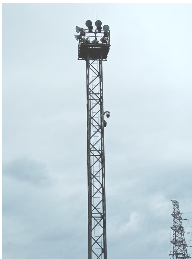
图 2-6 栈桥一侧照明及监控探头