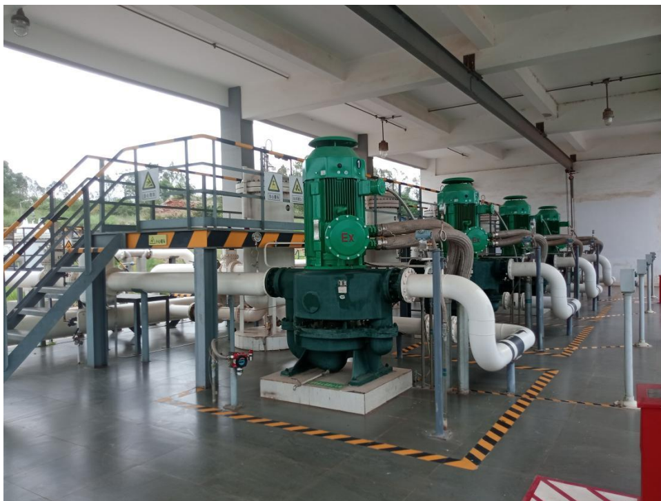
图 2-4 卸油泵棚