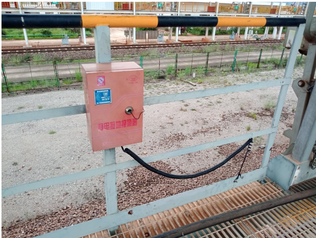
图2-8 栈桥上方设置的静电接地报警仪