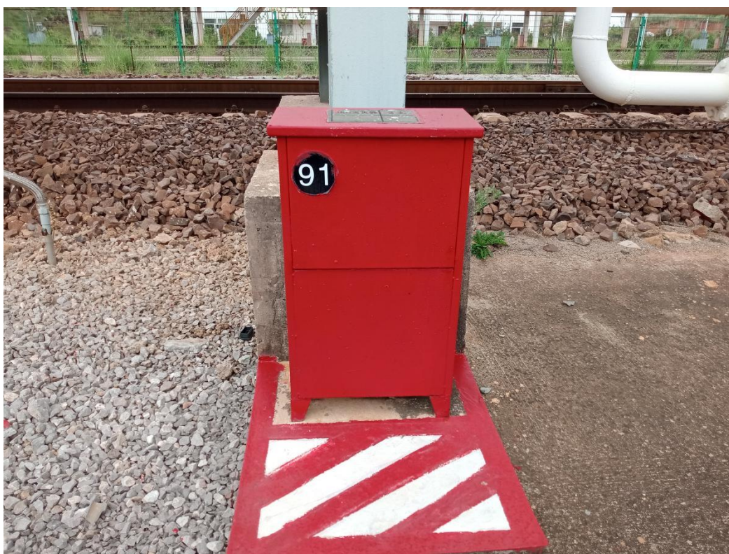
图2-7 应急物资、消防设施