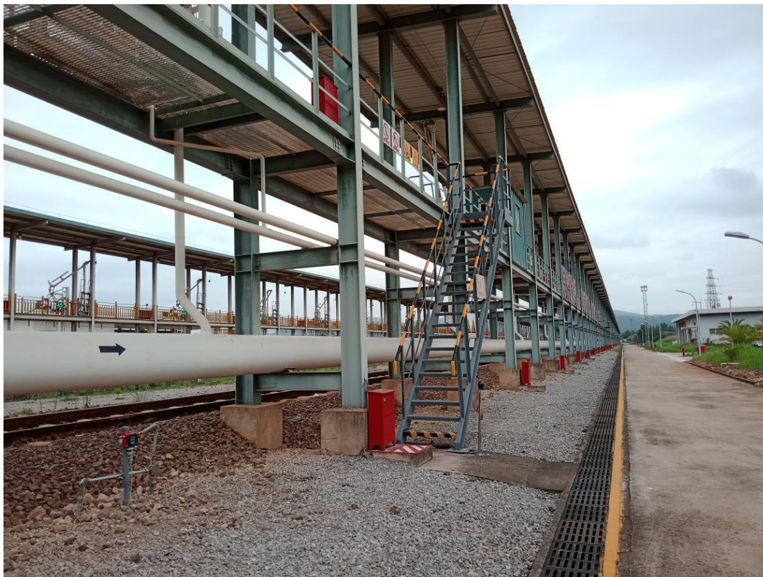
图 2-2 航煤卸油栈桥

中航油卸油区内设卸油栈桥一座，长 642m，宽 2m，上设 52 个鹤位，单侧卸油。栈桥下站台上设 4 台扫槽泵。在栈桥两端和沿栈桥每 60~80m 处设上下栈桥的梯子，共设 8 处上下梯子。栈桥设置雨棚，每隔 200~300m 设置一间休息室。栈桥下每个鹤管下方设有一个可燃气体检测报警仪（检定日期：2024 年 05 月 28 日，有效期：2025 年 05 月 27 日）。