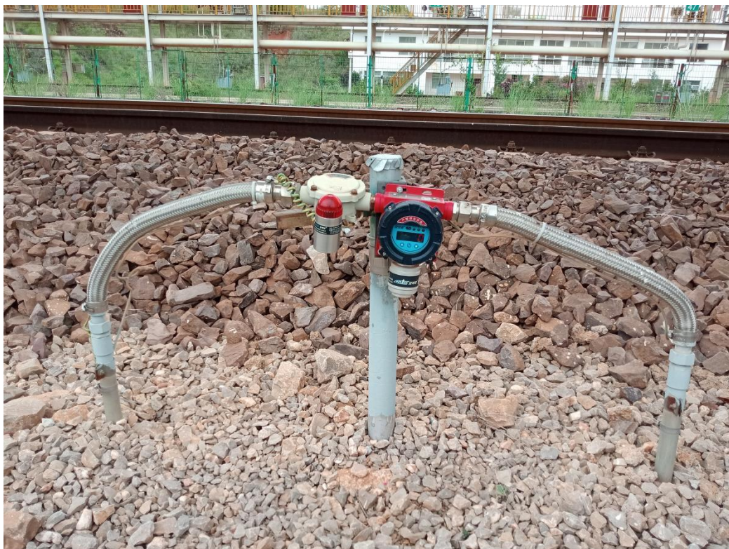
图 2-3 栈桥下方可燃气体检测报警仪