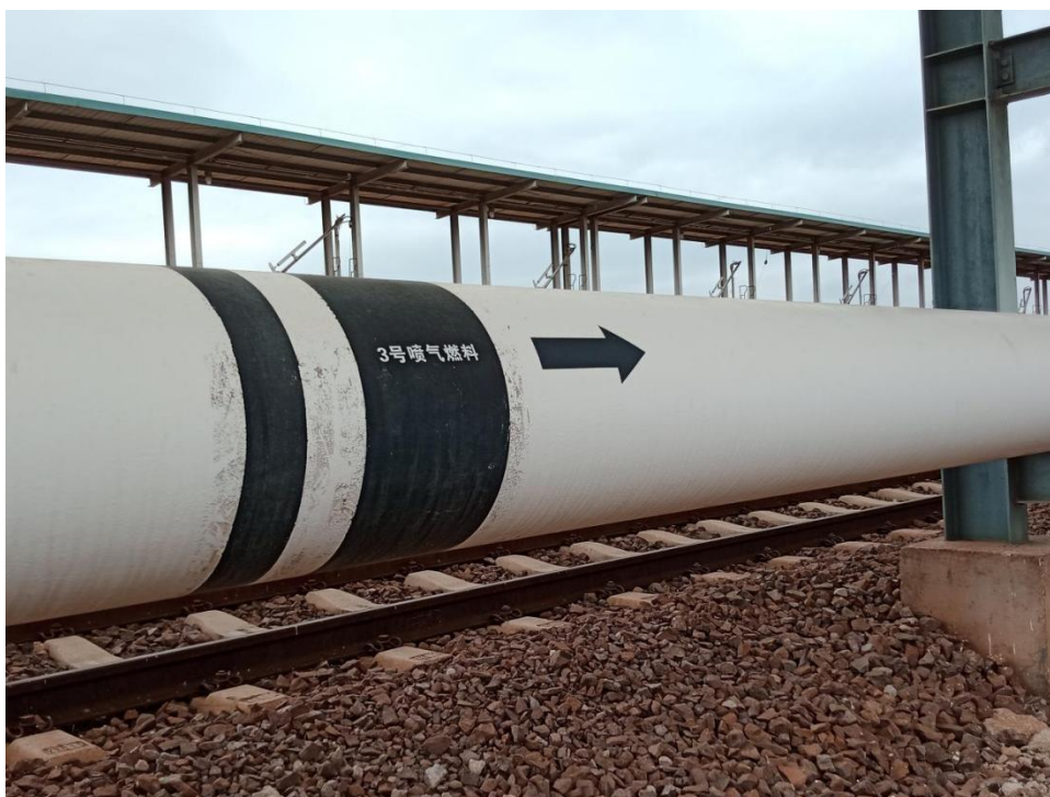
图 2-5 卸油管道

装卸栈桥下方设一根 DN400 的航煤输送管道，管道之间连接采用焊接方式，管道上的阀门采用钢制阀门；钢管及其附件的外表面，涂有防腐涂层；埋地钢管采取有防腐绝缘措施。管道上均有介质和流向标识。